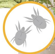
ヤケヒョウヒダニ