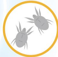
ヤケヒョウヒダニ